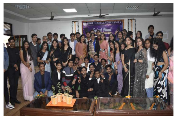
Talent Hunt 2023 (23 December 2023)