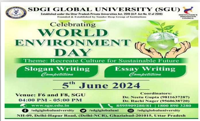
Celebrates World Environment Day!