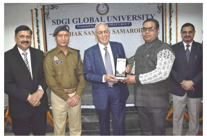
Shiksha Samman Samaroh