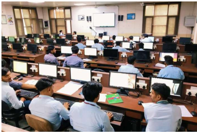
Web Tech Competition @ SGU