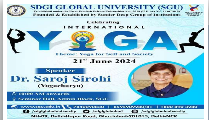
International Yoga Day!