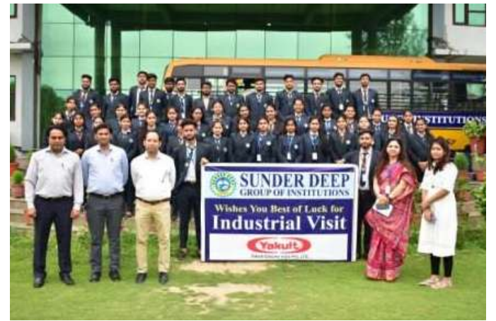
Industrial Visit at Yakult