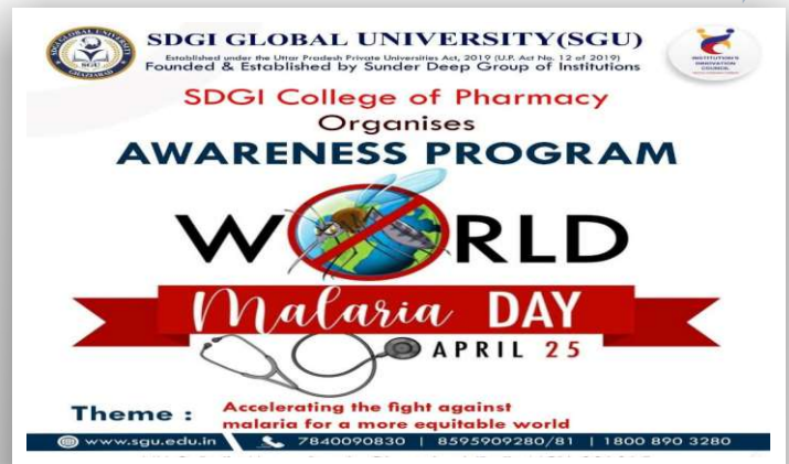
Awareness Program on World Malaria Day