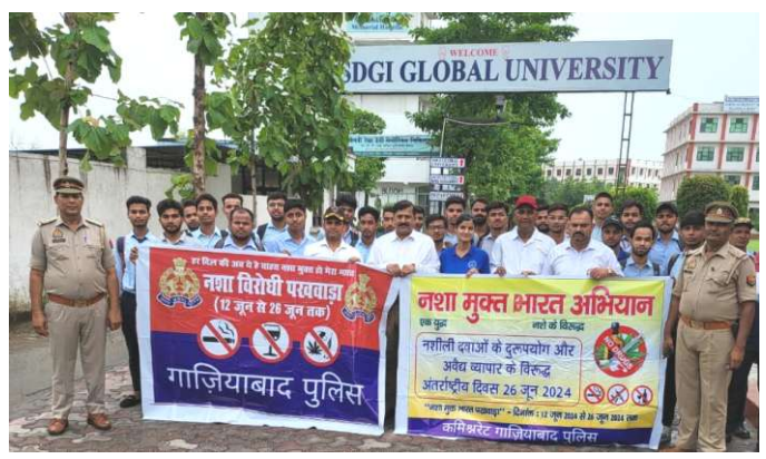
Anti-Drug Fortnight at SDGI Global University!