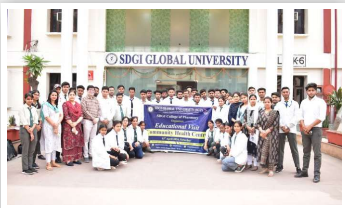
Visit to the Community Health Center (CHC)