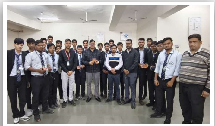
Hands-On Learning in Action